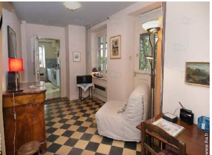
vue depuis le salon