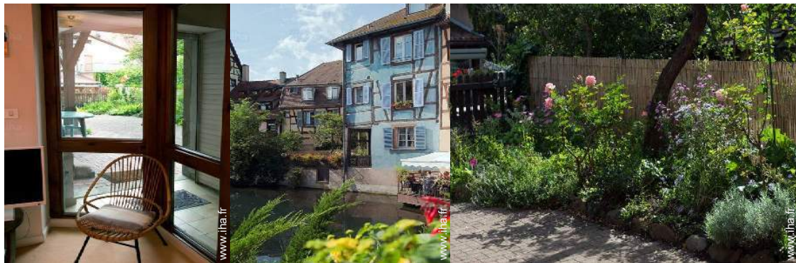
vue depuis le salon