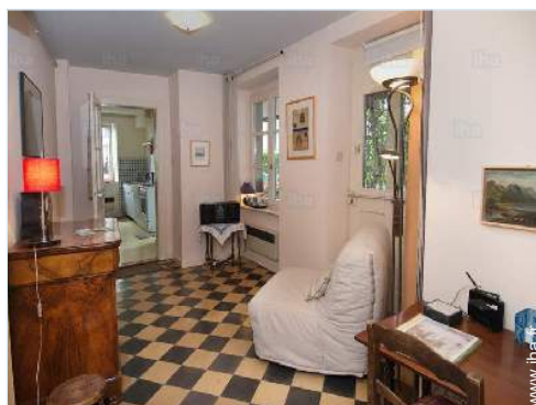
vue depuis le salon