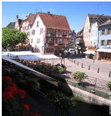
vue sur rue piétonne