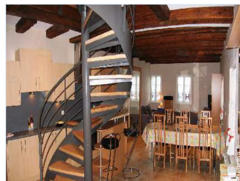
salle à manger