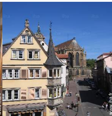
vue depuis l'appartement