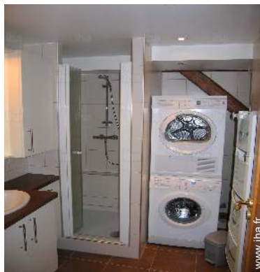
salle(s) de douche