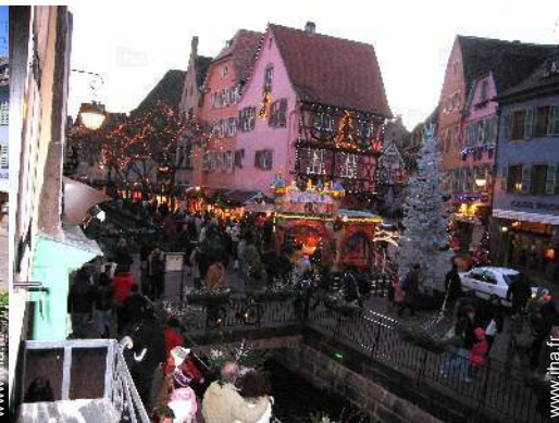
vue sur la place