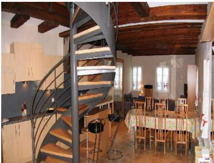
salle à manger