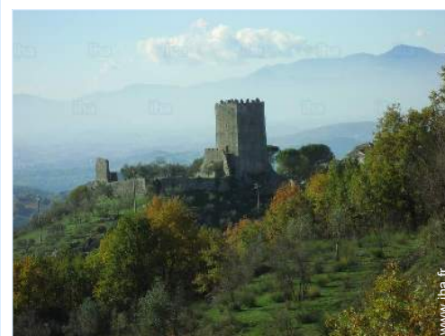
Villes à proximité

Garderie 15km Centre ville 7,5km Arrêt/station de bus 7,5km Liaison bus plage 15km Location de vélo/VTT 15km Location de moto/scooter 15km Location de voiture 15km Location de matériel de ski 50km Location linge/blanchisserie 15km Boulangerie 7,5km Petits commerces 7,5km Super marché 7,5km Salon de coiffure 7,5km Cyber café 5km Poste 7,5km Banque 7,5km Pharmacie 7,5km Médecin 5km Hôpital 15km Dispensaire 7,5km