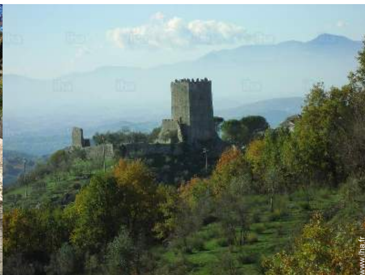
Villes à proximité