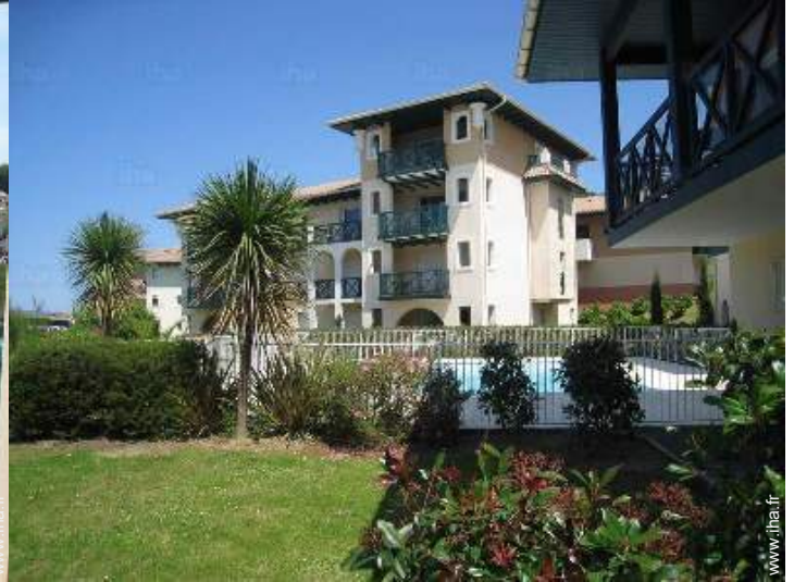
vue de la propriété