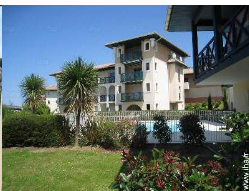
vue de la propriété