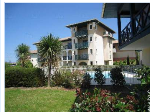
vue de la propriété