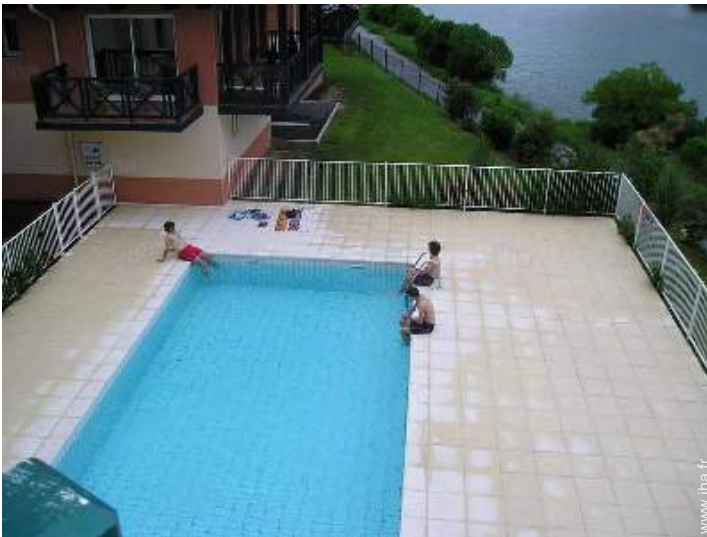
piscine dans la résidence