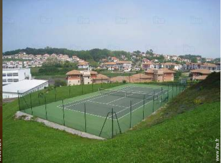
tennis dans la résidence