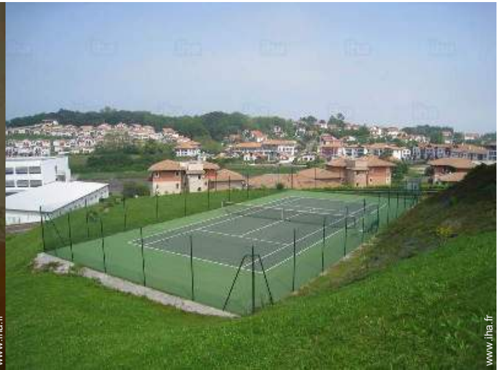
tennis dans la résidence