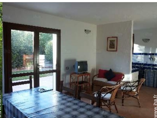
vue depuis la cuisine