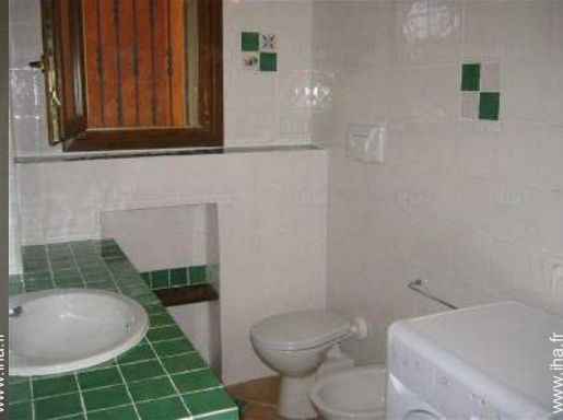
salle(s) de bain