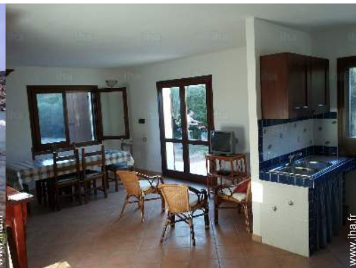
vue depuis le séjour