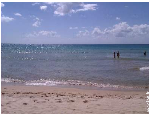
plage de sable