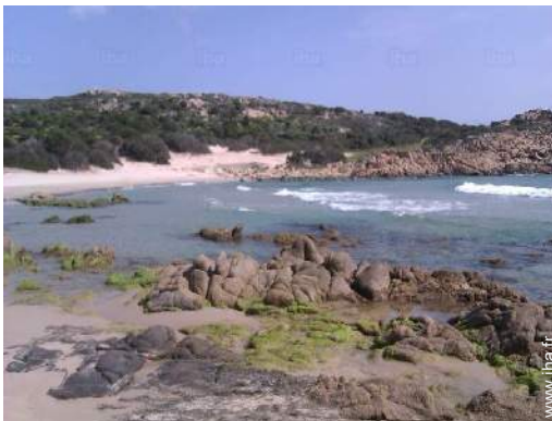
plage de rocher