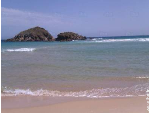
plage de sable