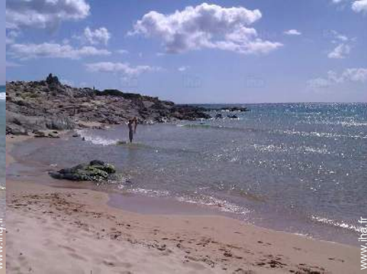
plage de sable