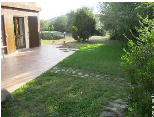
vue depuis le jardin/parc