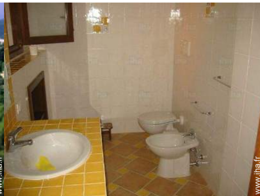
salle(s) de bain