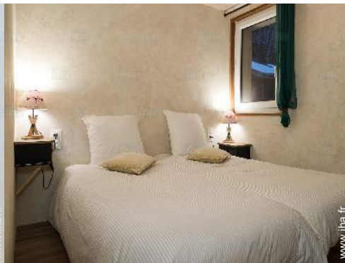
lits jumeaux simple