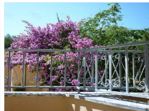
vue depuis la terrasse

Centre village Centre ville Location de voiture Boulangerie Petits commerces Super marché Salon de coiffure Poste Banque Distributeur automatique de billets Pharmacie Médecin Infirmière Hôpital Dispensaire