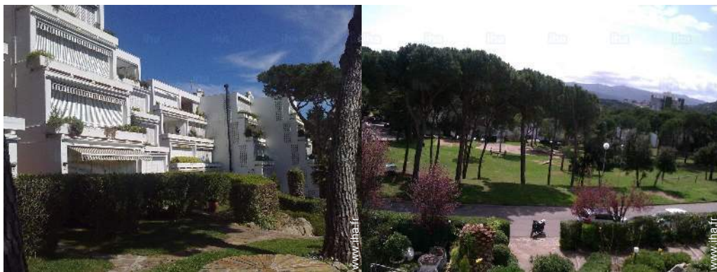
vue de la propriété