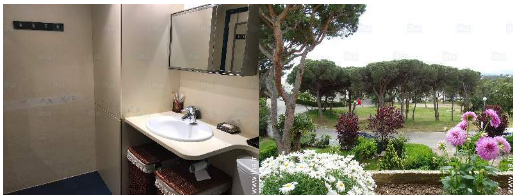
vue depuis l'appartement