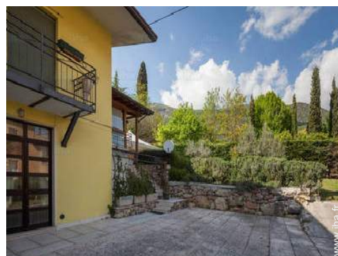
vue sur jardin/parc