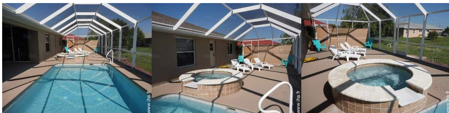
vue sur piscine