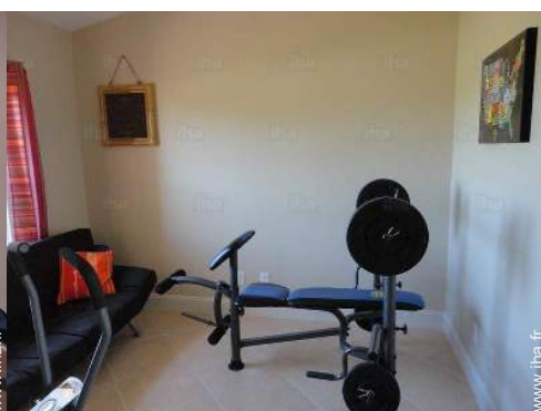
salle de sport