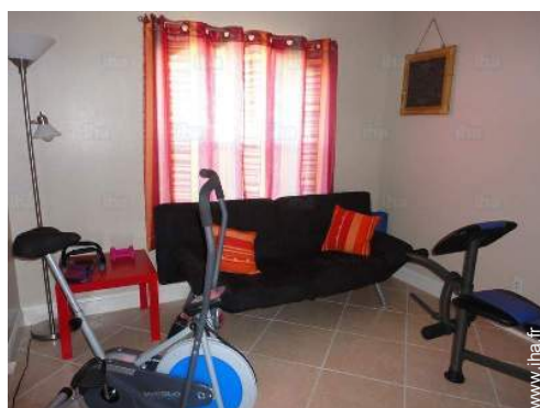
salle de sport