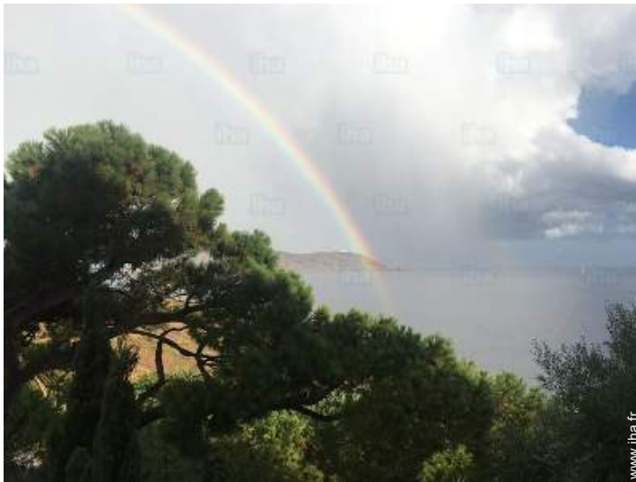
vue depuis le balcon