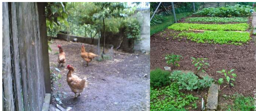
Les animaux de la maison