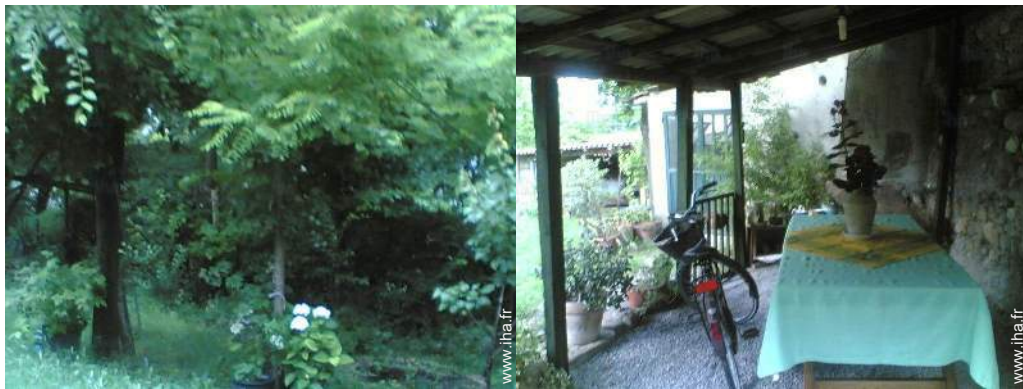
vue depuis la chambre