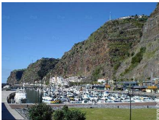
loisirs nautiques à proximité