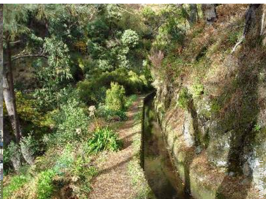
chemin de promenade