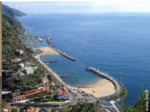
loisirs balnéaires à proximité