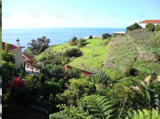
vue sur océan