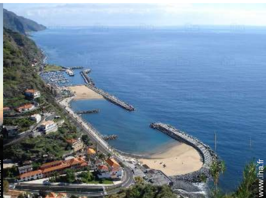
plage de sable