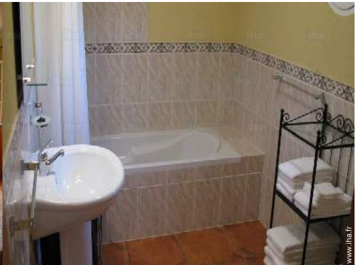
salle(s) de bain