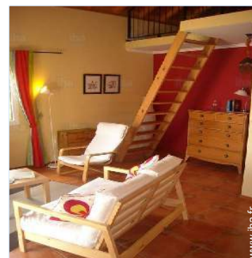
vue depuis le séjour