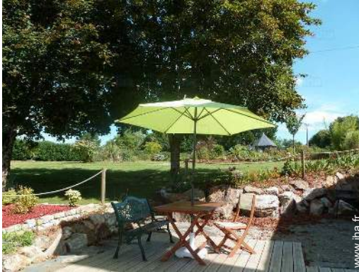
salon de jardin