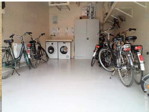
Equipements à disposition