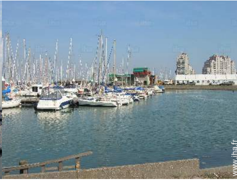
port de plaisance