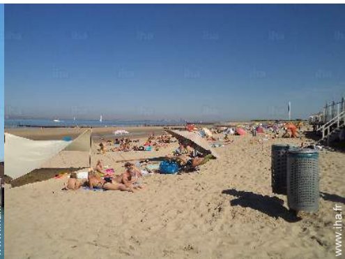
loisirs balnéaires à proximité