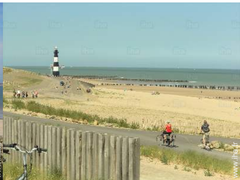
loisirs balnéaires à proximité