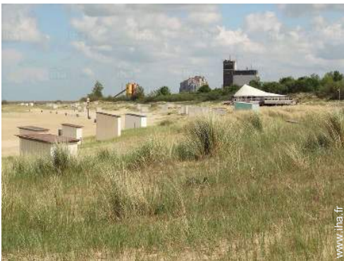
loisirs balnéaires à proximité