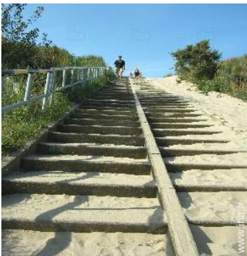
plage de sable