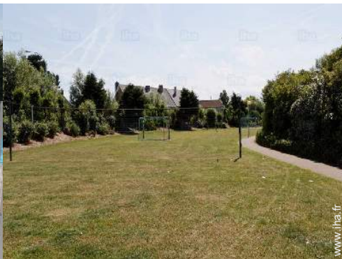
terrain de volley