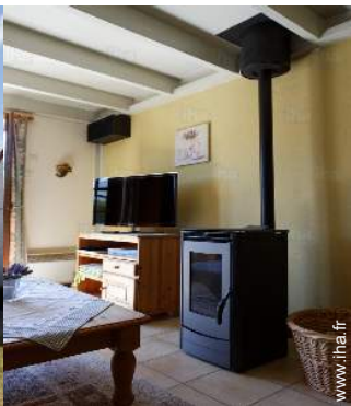
poêle à bois