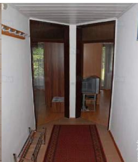
Agencement intérieur et commodités