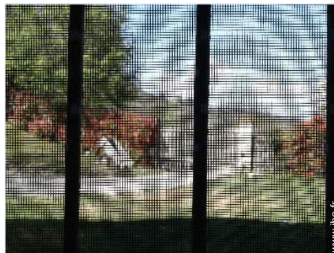
moustiquaire aux fenêtres