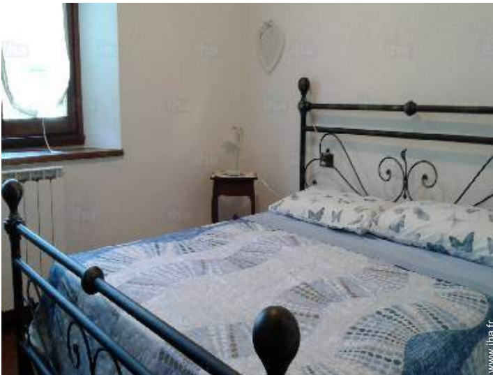
vue depuis la chambre