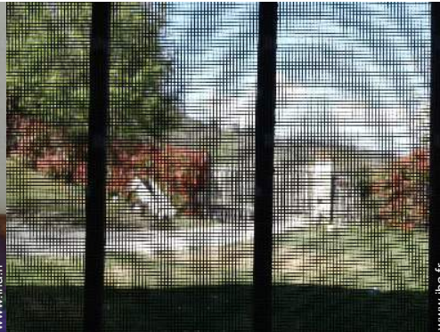
moustiquaire aux fenêtres