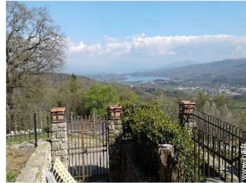
vue sur lac