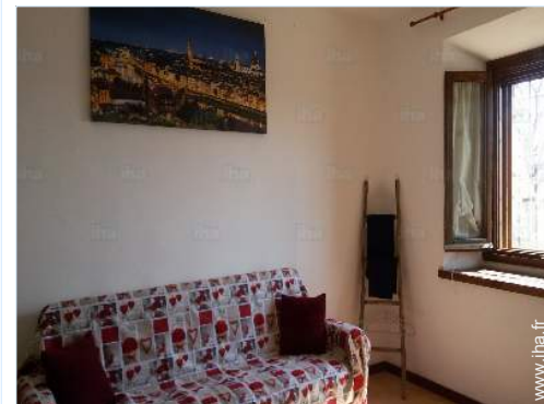
canapé-lit(s) 2 pers

Boulangerie 4km Petits commerces 4km Super marché 4km Boutiques de luxe et marques 2,5km Poste 4km Banque 4km Pharmacie 4km Hôpital 15km