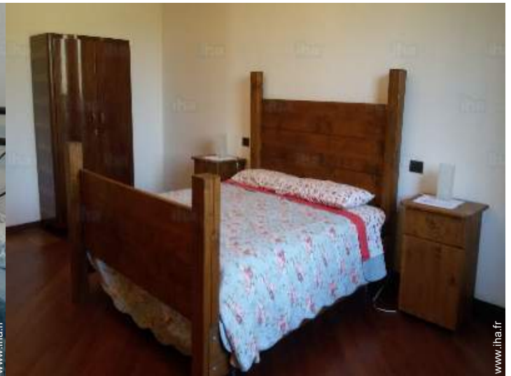
vue depuis la chambre