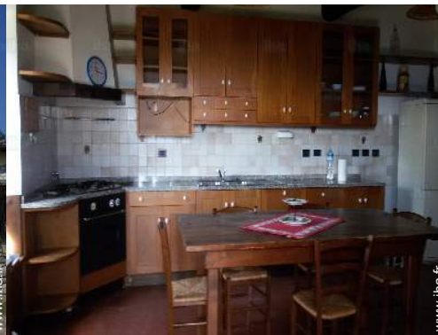
vue depuis la cuisine