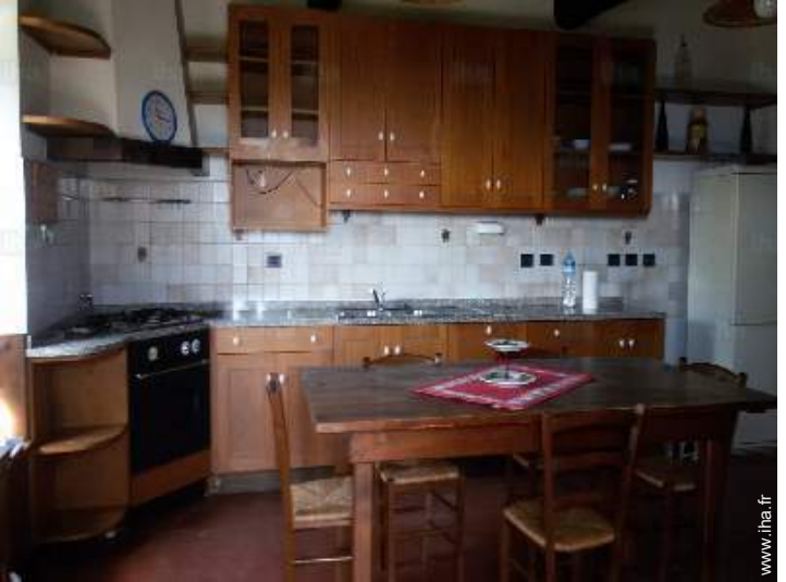
vue depuis la cuisine