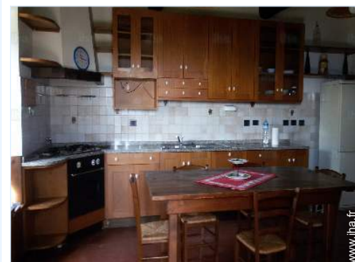
vue depuis la cuisine