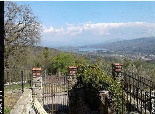
vue sur lac