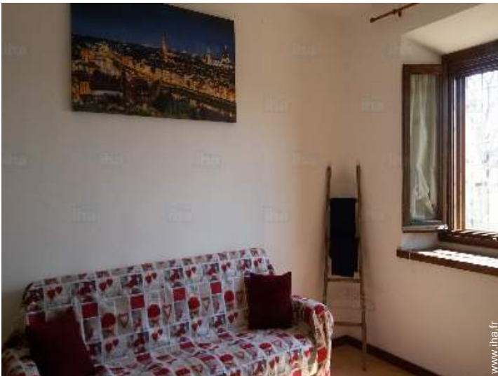
canapé-lit(s) 2 pers