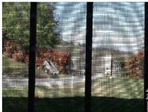
moustiquaire aux fenêtres