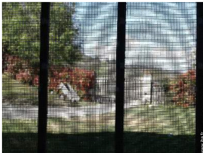
moustiquaire aux fenêtres