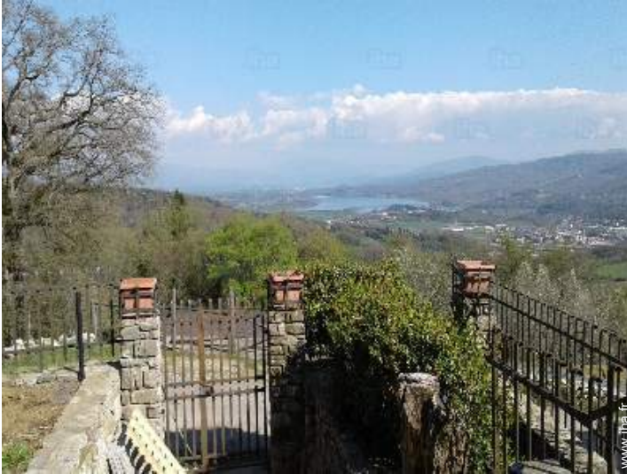
vue sur lac