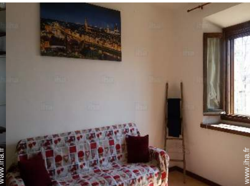
canapé-lit(s) 2 pers