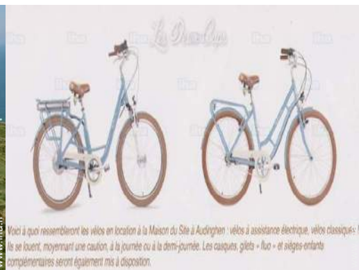
VTT (itinéraire circuit)