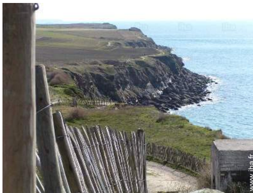
chemin de promenade