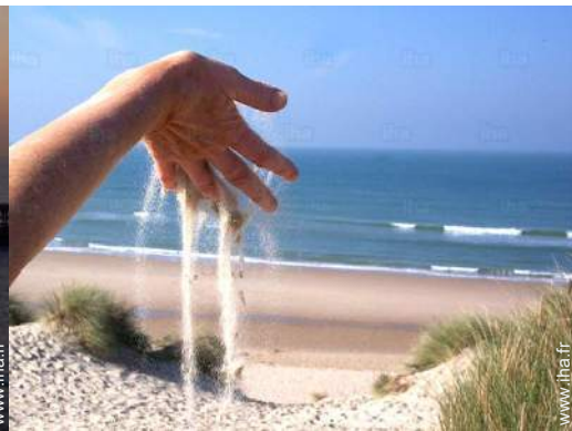
Attraits et détente