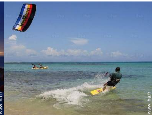
loisirs nautiques à proximité