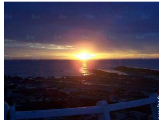
plage de rocher