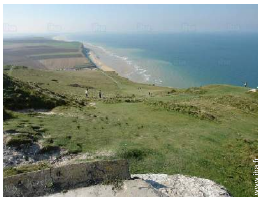
loisirs à proximité