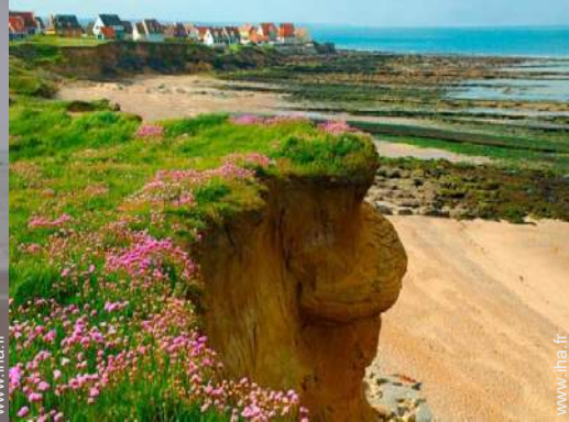
chemin de promenade