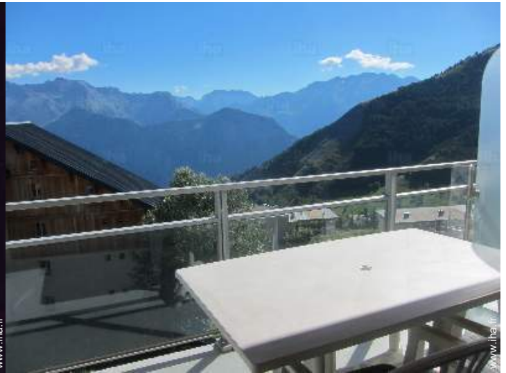
vue depuis l'appartement