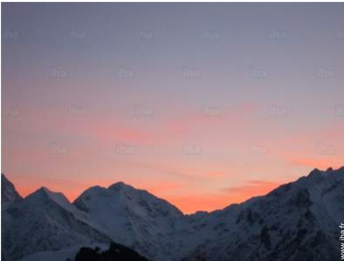
vue depuis l'appartement