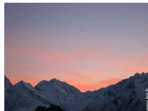
vue depuis l'appartement