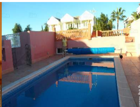
vue depuis la piscine