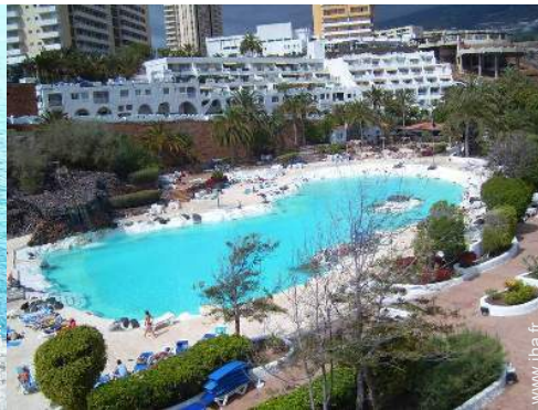
loisirs nautiques à proximité