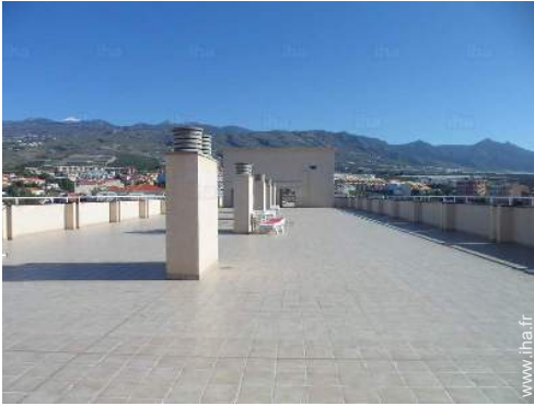
vue depuis la terrasse