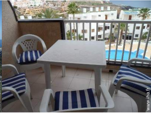
vue sur piscine