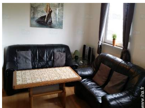
vue depuis le séjour