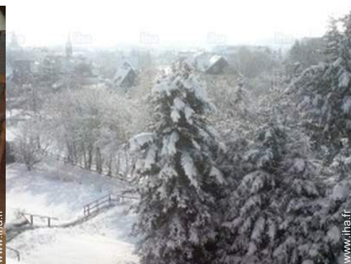
vue sur jardin/parc