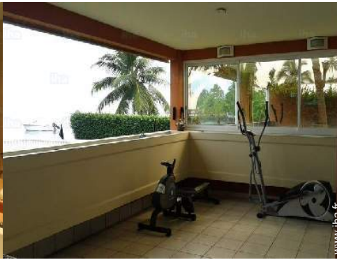
machine(s) de musculation