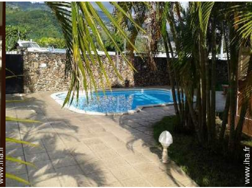
piscine dans la résidence