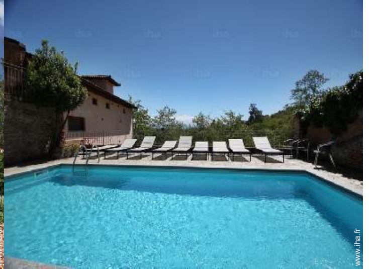
piscine dans la résidence