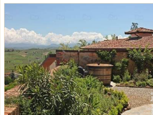
vue depuis le jardin/parc

Centre village 200m Boulangerie 200m Traiteur 200m Petits commerces 100m Poste 200m Banque 200m Distributeur automatique de billets 200m Pharmacie 200m Médecin 200m