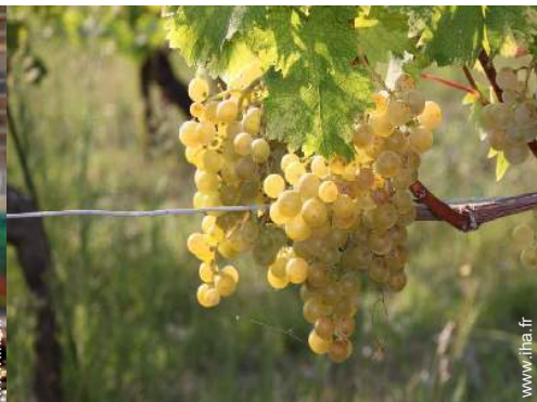
cave et dégustation de vin