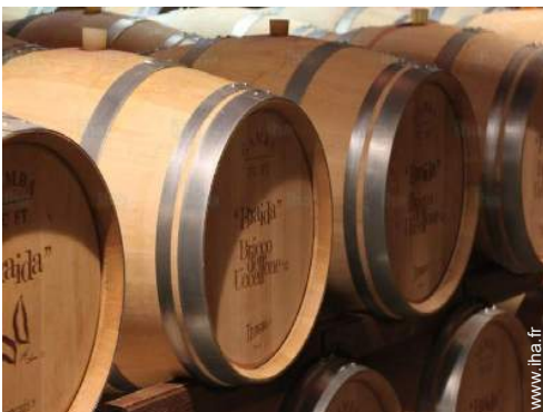
cave et dégustation de vin