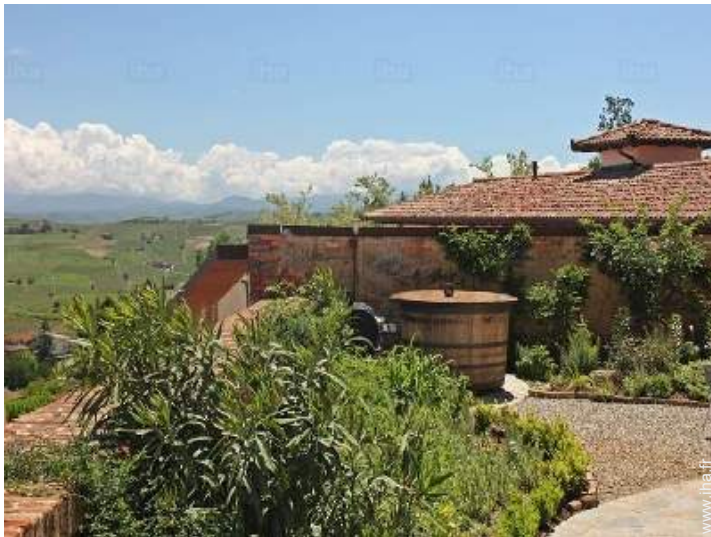
vue depuis le jardin/parc