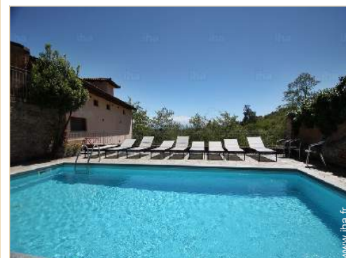
piscine dans la résidence