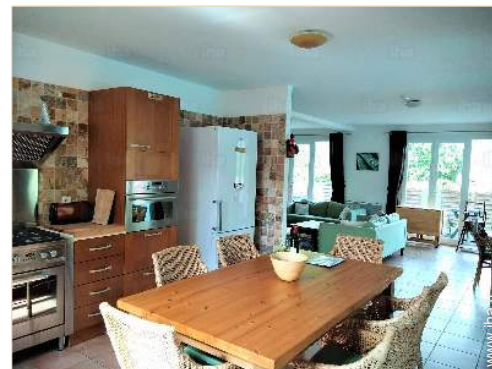
grande cuisine américaine

Barbecue, table(s) de jardin, 15 chaise(s) de jardin, 8 chaise(s) longue(s), douche extérieure