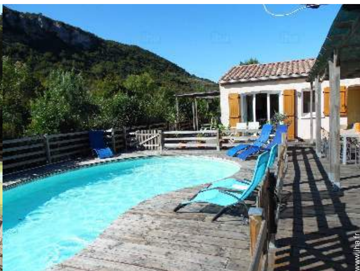
vue depuis la piscine