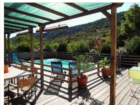
vue depuis la maison