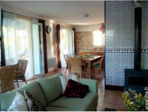
vue depuis la cuisine