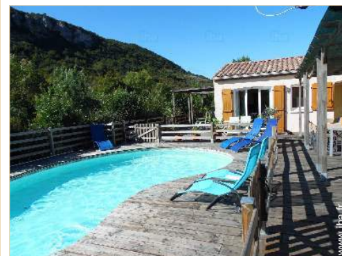
vue depuis la piscine

Centre village 200m Super marché 5km Poste 5km Distributeur automatique de billets 10km Médecin 10km