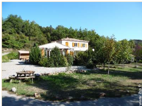
Villa de Prestige