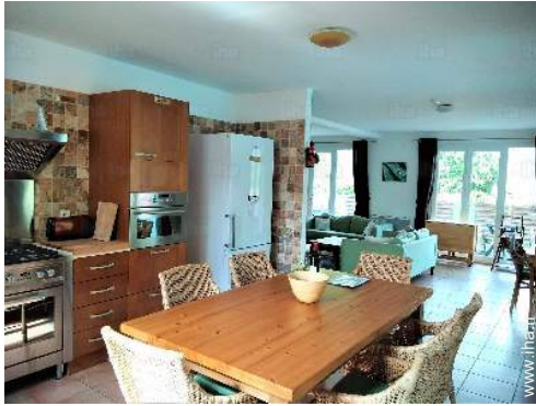
grande cuisine américaine