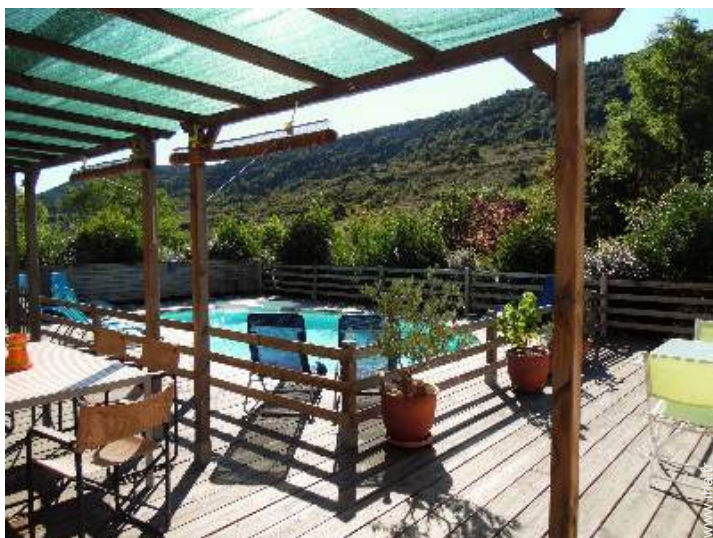
vue depuis la maison