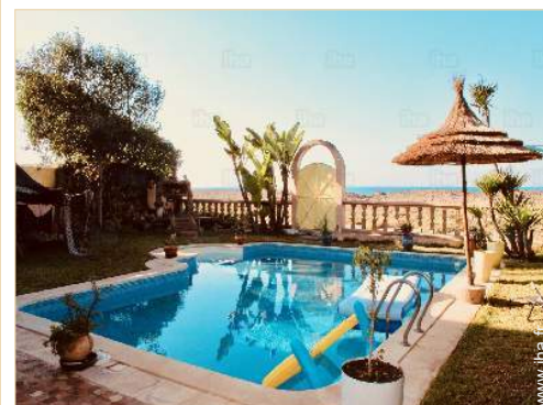
vue depuis la piscine