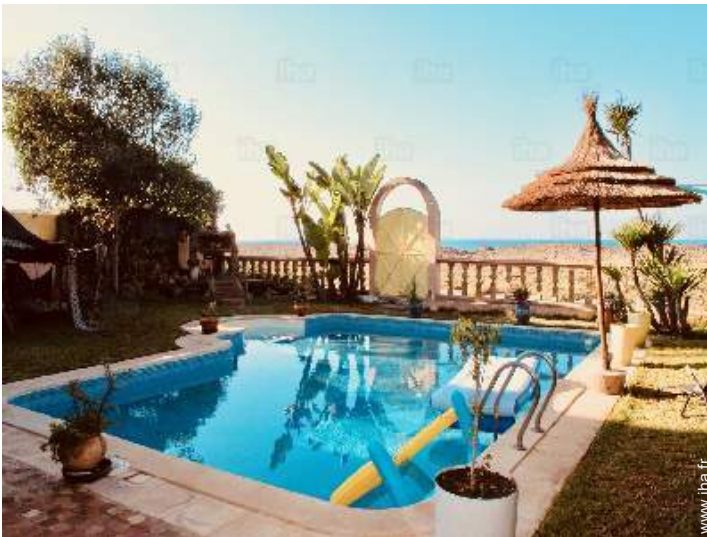
vue depuis la piscine