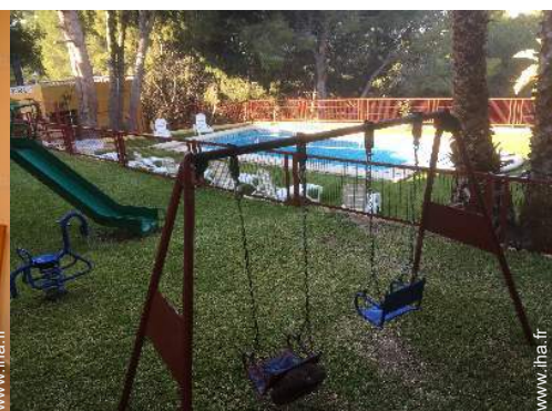
Equipements à disposition