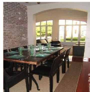
salle à manger

Centre village 200m Arrêt/station de bus 200m Location de vélo/VTT 7,5km Location de voiture 7,5km Location de bateau 4km Boulangerie 300m Super marché 2,5km Boutiques de luxe et marques 7,5km Salon de coiffure 200m Cyber café 4km Poste 300m Banque 4km Distributeur automatique de billets 4km Pharmacie 4km Médecin 300m Infirmière 300m Hôpital 7,5km