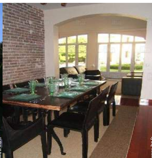
salle à manger