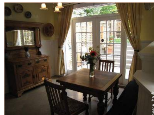
vue depuis la salle à manger

Centre ville 1,5km Arrêt/station de bus <50m Location de bateau 500m Boulangerie 500m Petits commerces 300m Super marché 300m Cyber café 100m Poste 100m Banque 100m Distributeur automatique de billets 100m Pharmacie 100m Hôpital 800m