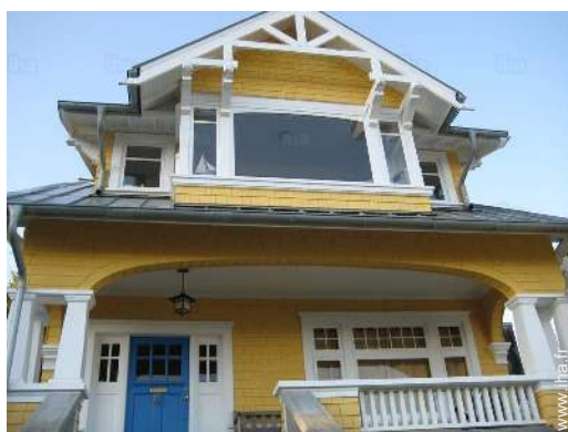
Maison de Charme