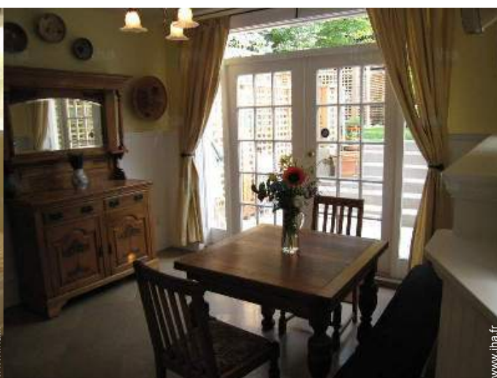
vue depuis la salle à manger