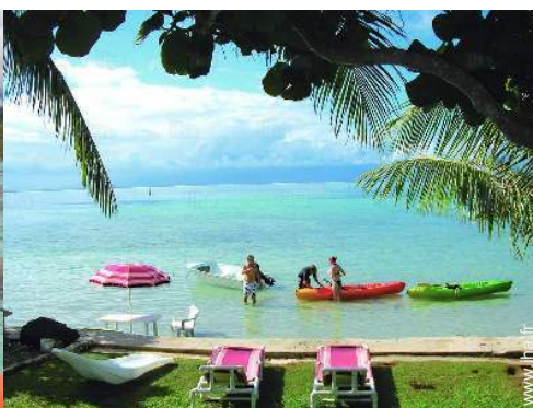
vue sur mer