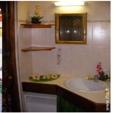
salle(s) de bain