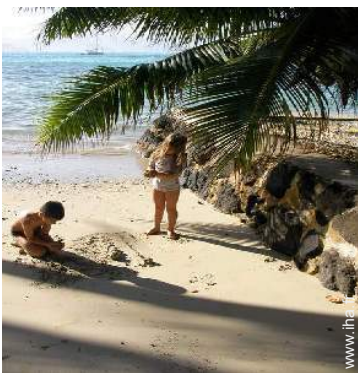
accès direct plage