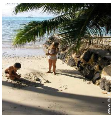
accès direct plage