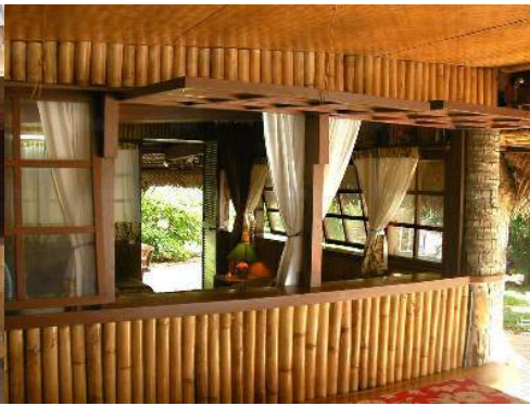
vue depuis la cuisine