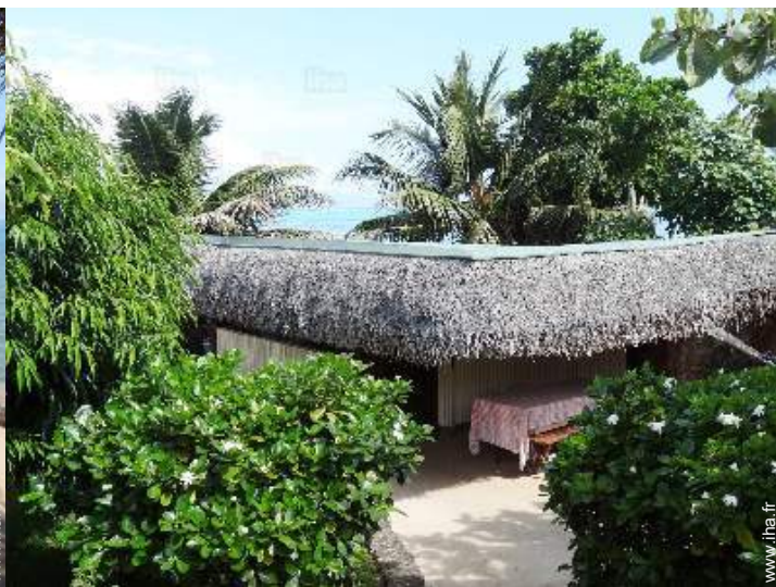
Bungalow de Charme