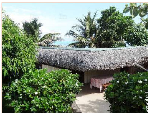
Bungalow de Charme

Privilèges : Accès direct plage, corps-mort