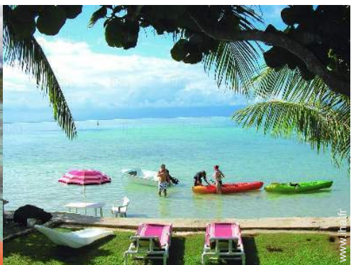
vue sur mer