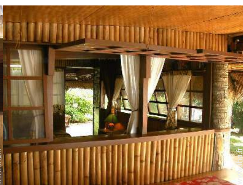
vue depuis la cuisine