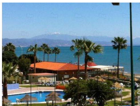
vue depuis le balcon