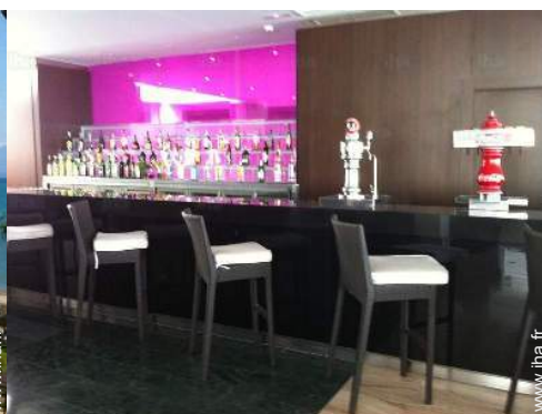
Equipements de loisir