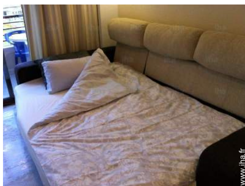
Agencement intérieur et commodités