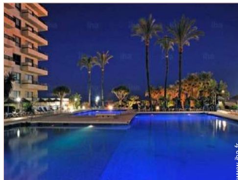
vue depuis le jardin/parc