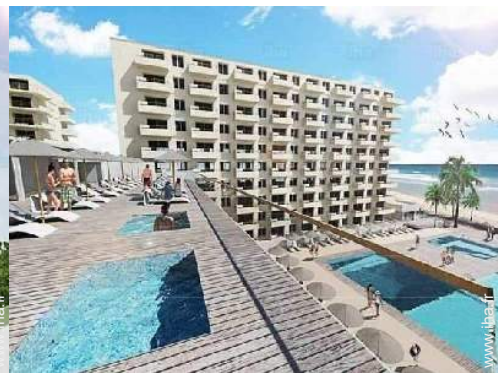
vue de la propriété