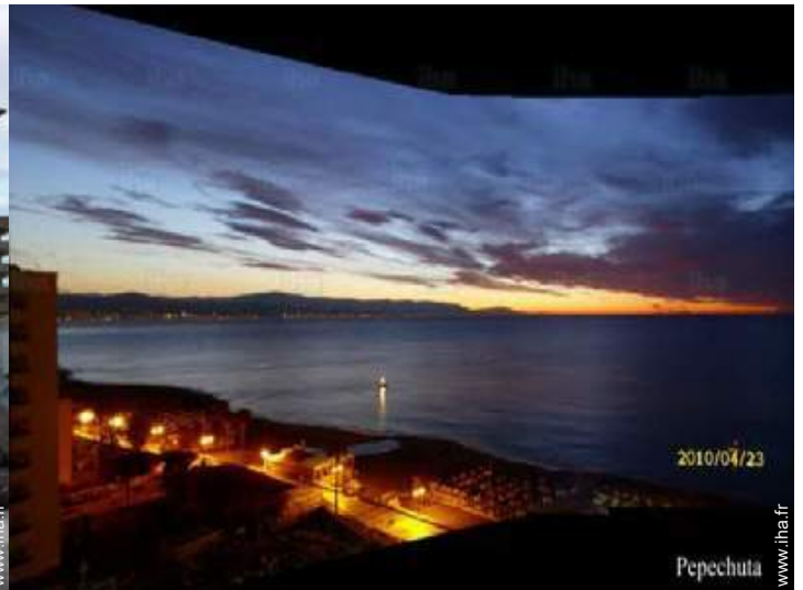
vue depuis la chambre