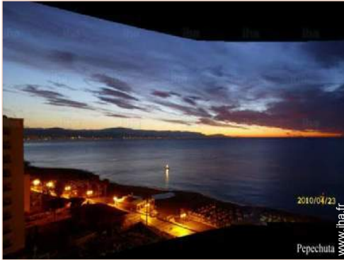
vue depuis la chambre