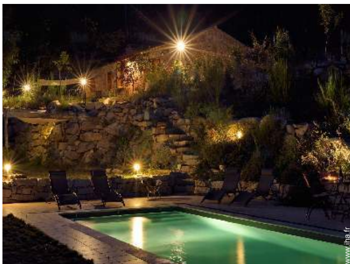
vue depuis la piscine