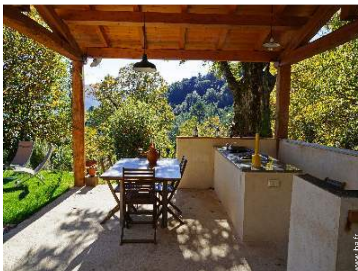
Equipements à disposition