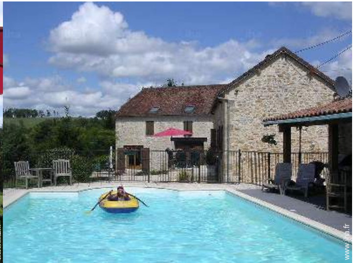
Maison de Charme