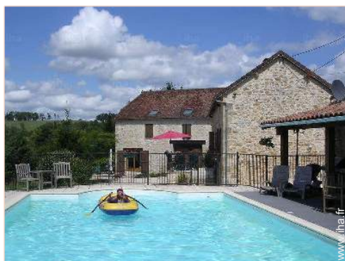
Maison de Charme