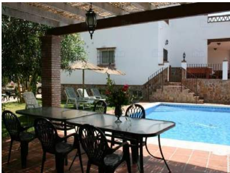
salon de jardin