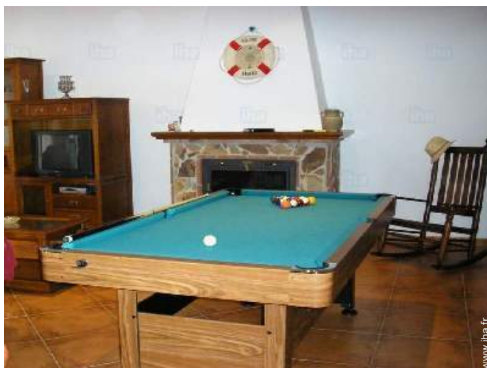
table de billard