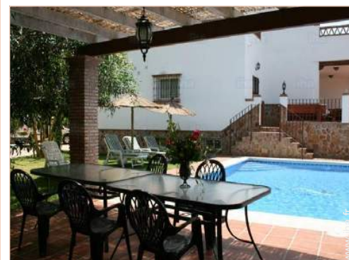
salon de jardin