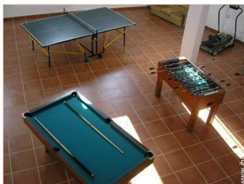
Equipements de loisir

Machine(s) de musculation, table de billard, babyfoot, jeux de fléchettes, table de ping-pong, 2 raquette(s) de ping-pong