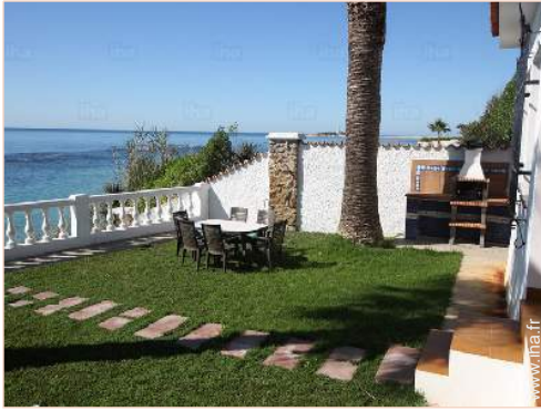
vue sur mer