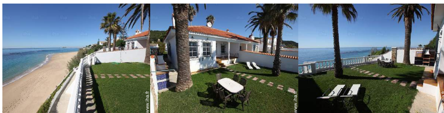
salon de jardin