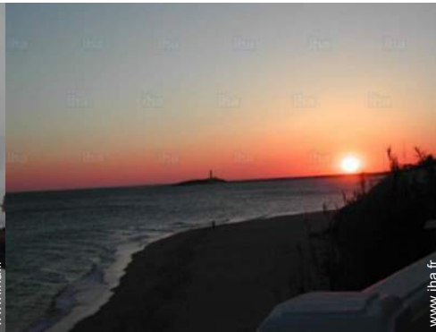
vue sur coucher de soleil