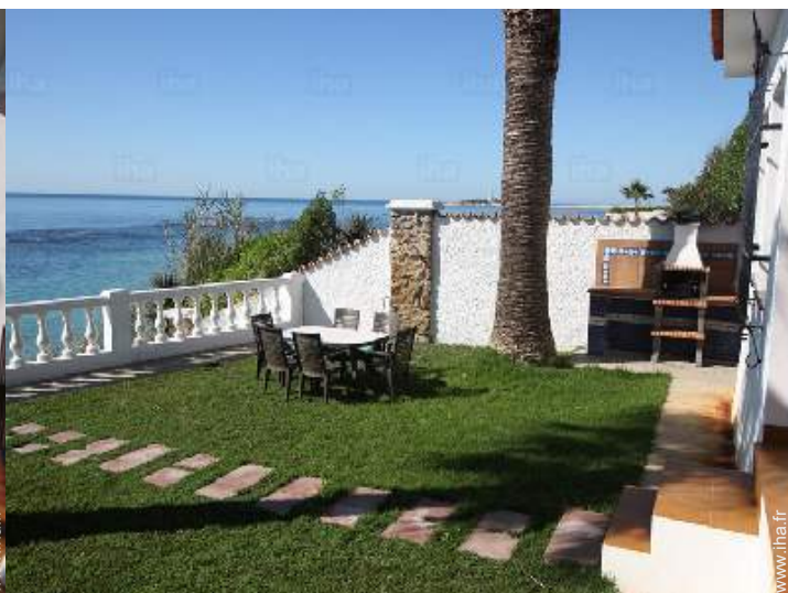
vue sur mer