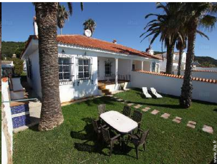
salon de jardin