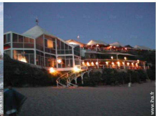
Equipements de loisir