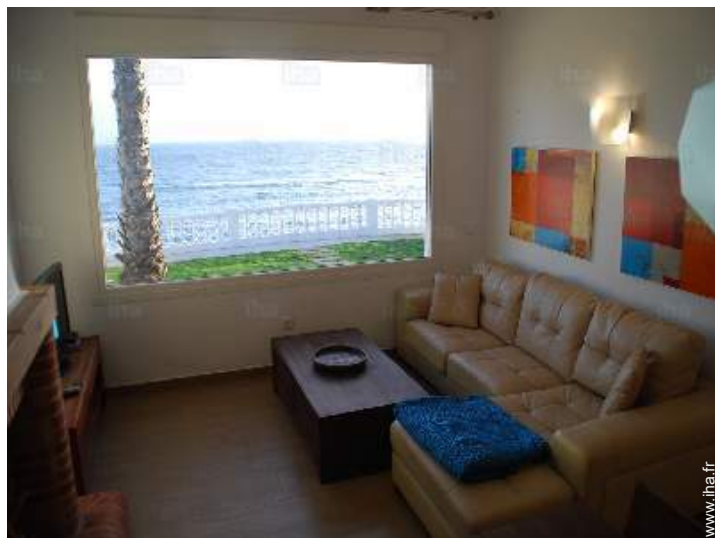
vue depuis le salon