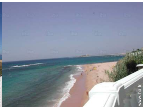
vue sur mer