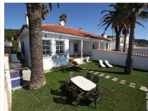
salon de jardin