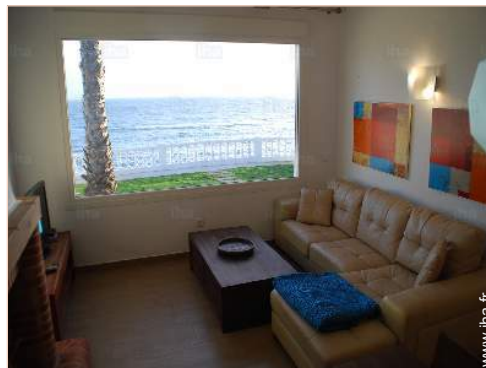
vue depuis le salon