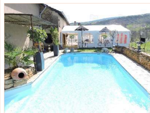
vue sur piscine

Boulangerie 1km Petits commerces 1km Super marché 10km Salon de coiffure 1km Poste 1km Pharmacie 1km