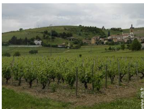
vue sur vignobles