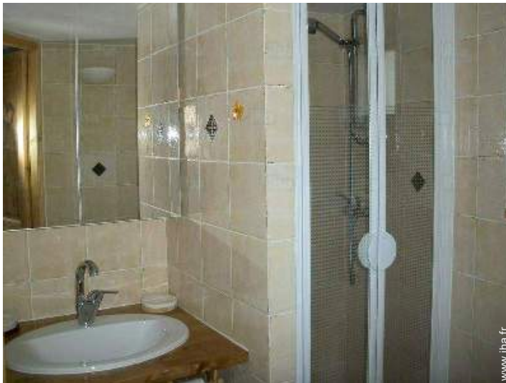
salle(s) de douche