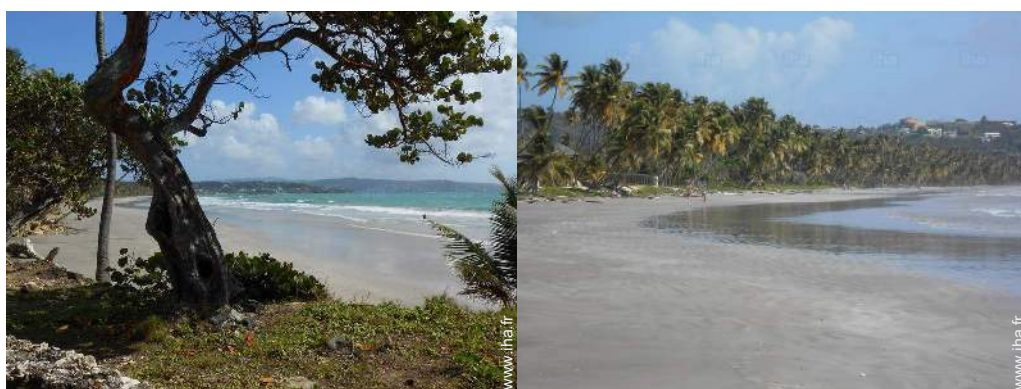
plage de sable