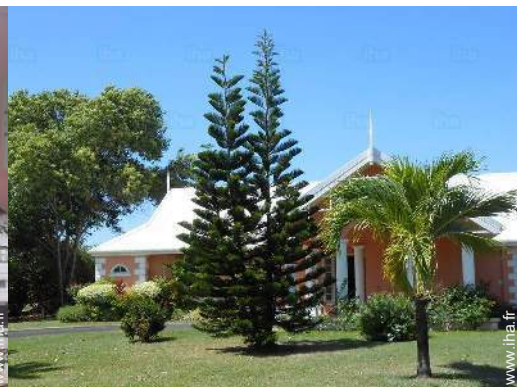
vue depuis le jardin/parc