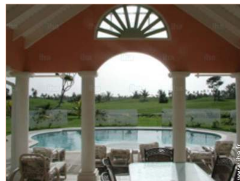
vue depuis le patio