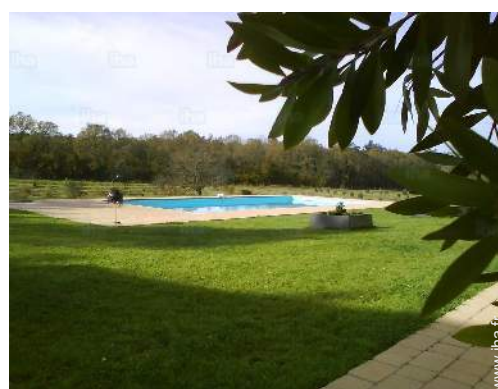
Piscine d'eau de mer