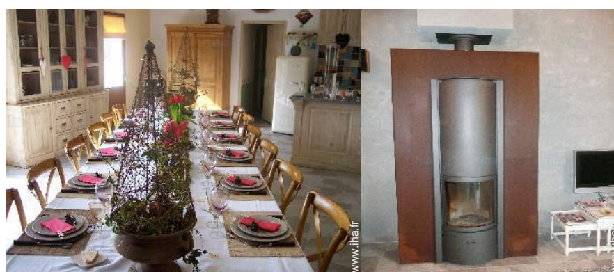
salle à manger