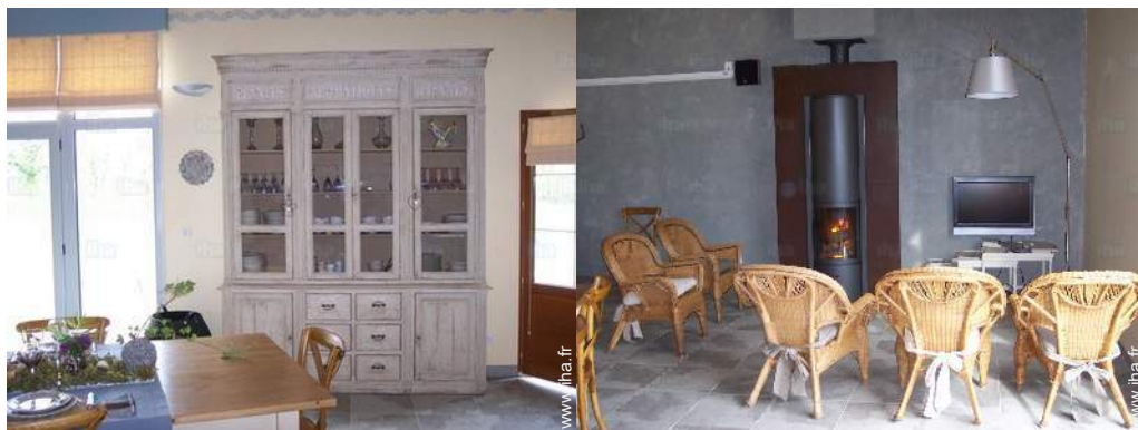
salle à manger