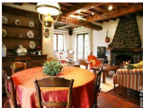
vue depuis la salle à manger