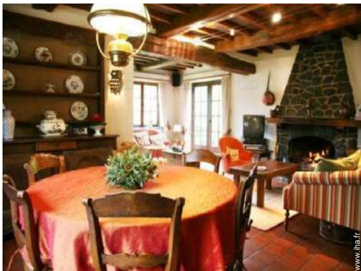
vue depuis la salle à manger