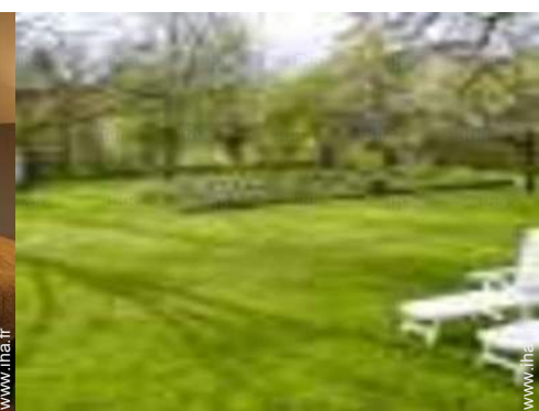
vue sur jardin/parc