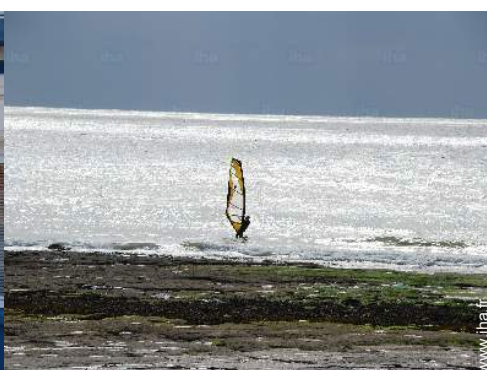
loisirs à proximité