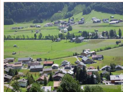
vue sur campagne

Centre village <50m Arrêt/station de bus 800m Liaison bus pistes de ski <50m Location de vélo/VTT 1km Location de matériel de ski 1km Boulangerie 100m Traiteur 500m Super marché 500m Salon de coiffure 500m Poste 500m Banque 500m Distributeur automatique de billets 500m Pharmacie 1km Médecin 1km Hôpital 40km