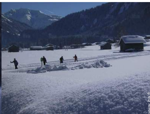
loisirs d'hiver à proximité