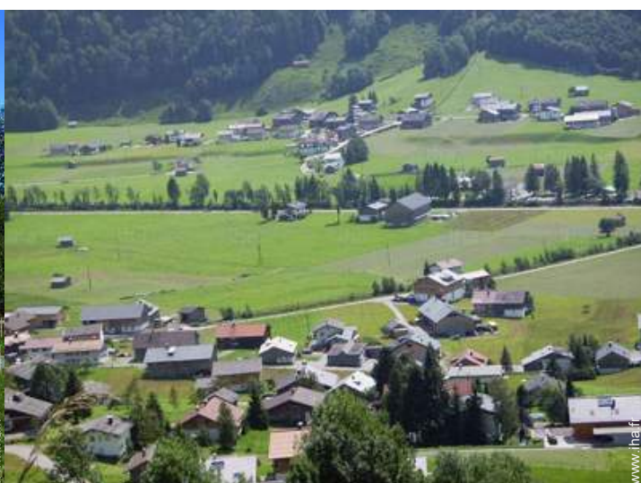
vue sur campagne