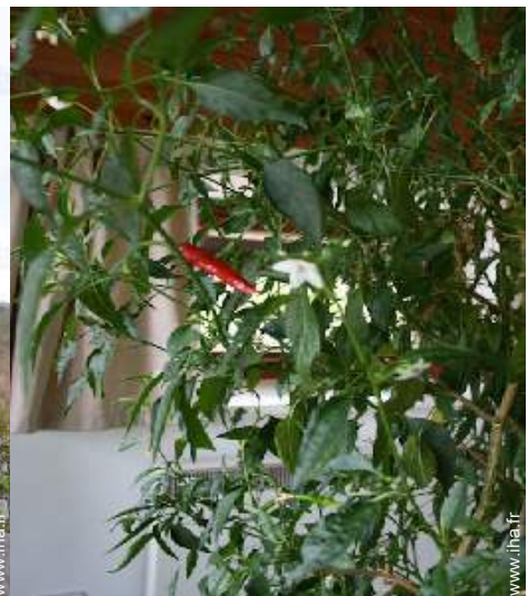
Présence sur place