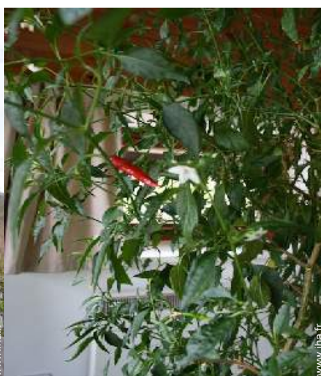
Présence sur place