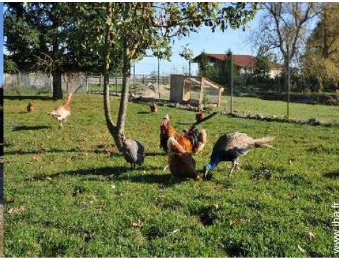
aménagement de loisirs