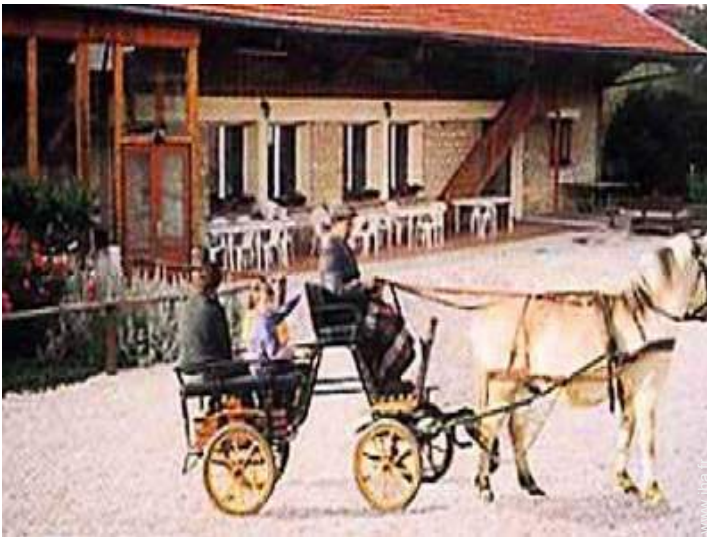
balade à cheval