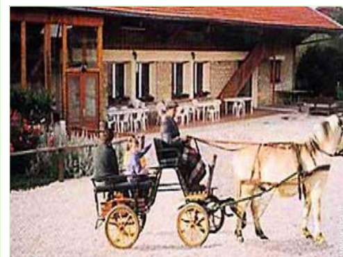
balade à cheval