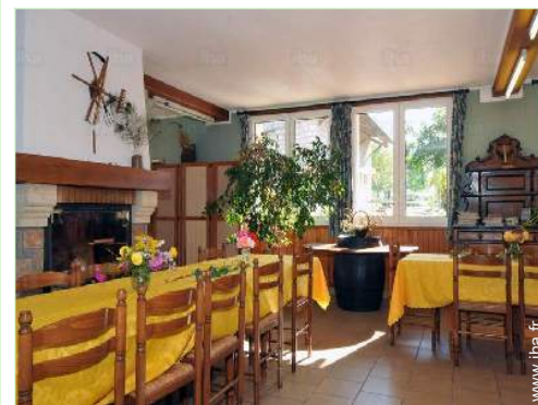
vue depuis la salle à manger

Centre village <50m Centre ville 10km Arrêt/station de bus 10km Location de vélo/VTT 10km Location de voiture 10km Location linge/blanchisserie 10km Boulangerie 10km Traiteur 10km Petits commerces 10km Super marché 10km Salon de coiffure 10km Poste 10km Banque 10km Distributeur automatique de billets 10km Pharmacie 10km Médecin 10km Infirmière 10km Hôpital 10km