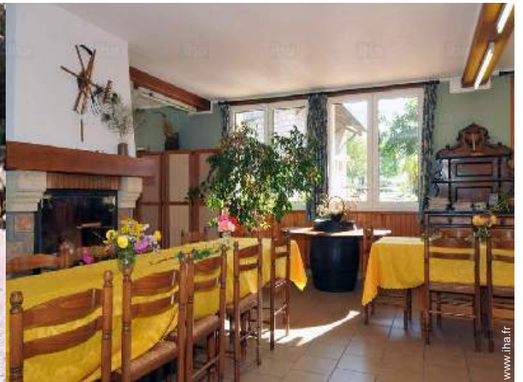
vue depuis la salle à manger