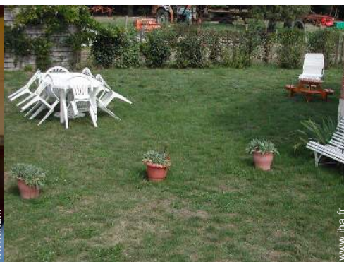
Equipements à disposition