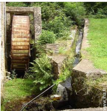
chemin de promenade