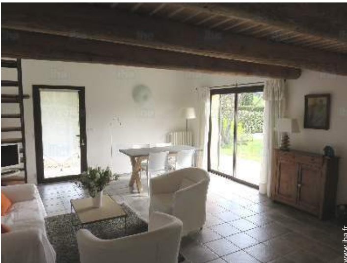
salle à manger