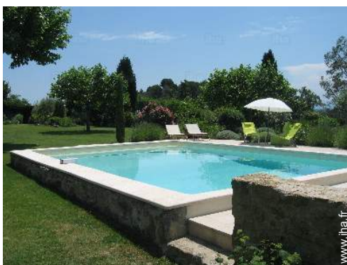
vue sur piscine