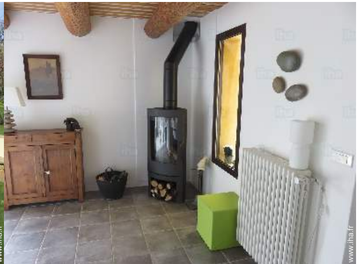
coin du feu