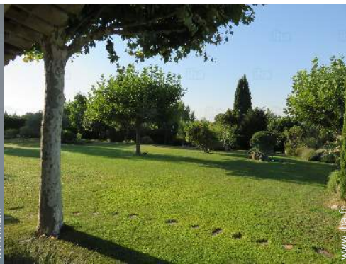
vue sur jardin/parc