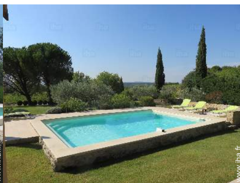
vue sur piscine