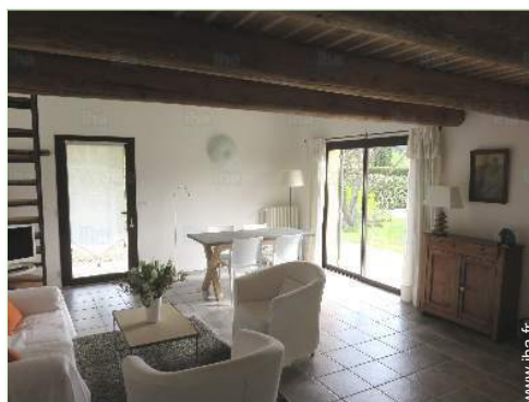
salle à manger