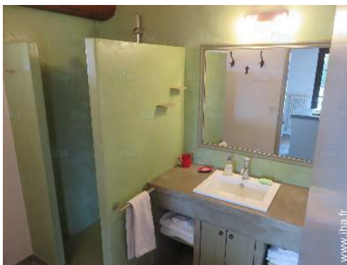
salle(s) de douche