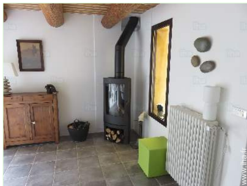
coin du feu