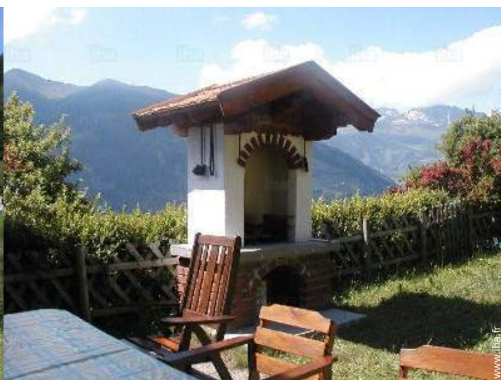
vue depuis la terrasse