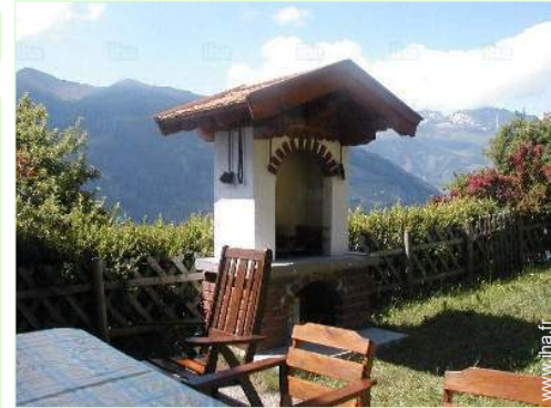
vue depuis la terrasse